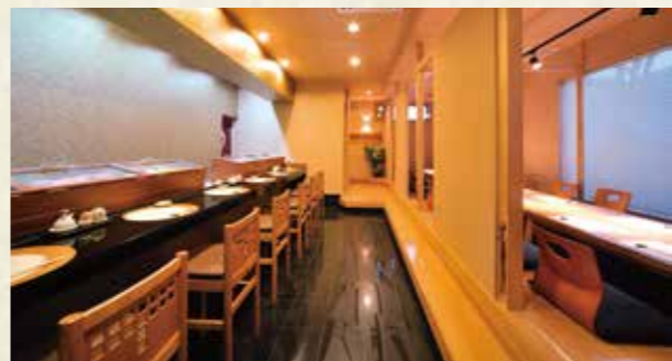
人気のカウンター席