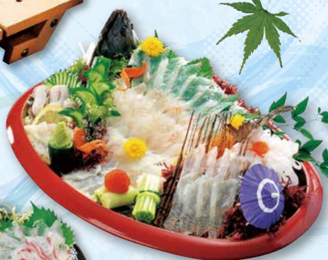
予約 11-9 45cm ヒラメの活造り〈4人前〉 10,260円