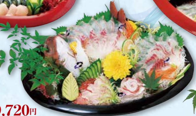
予約 11-8 45cm 鯛の活造り〈4人前〉 9,720円