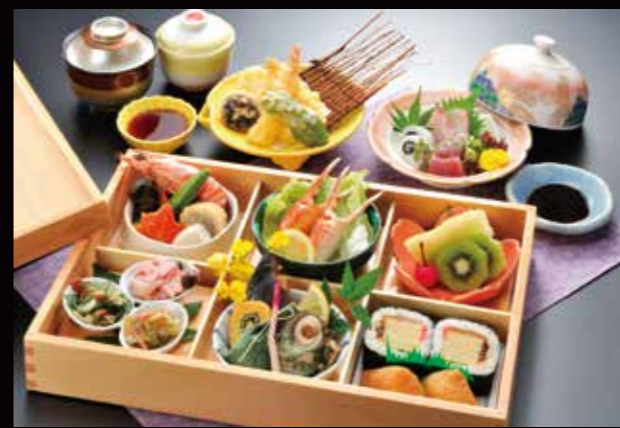
予約 13-5 松華堂 6,500円