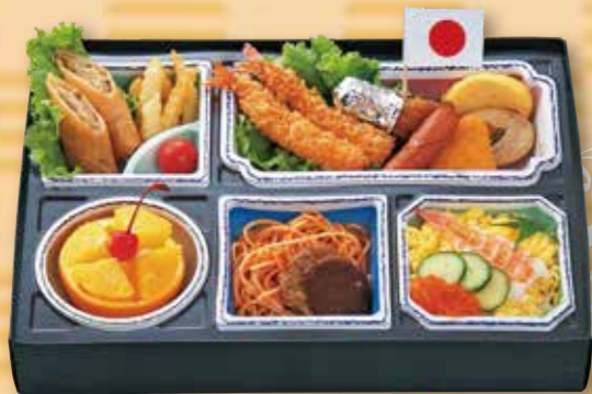
予約 14-5 お子様パック 3,500円