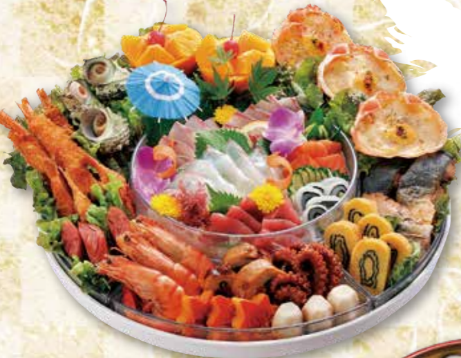
予約 12-4 40cm 刺身入オードブル 11,340円