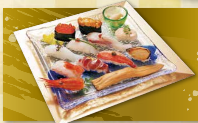
1-2 吉祥にぎり(11カン) 6,000円