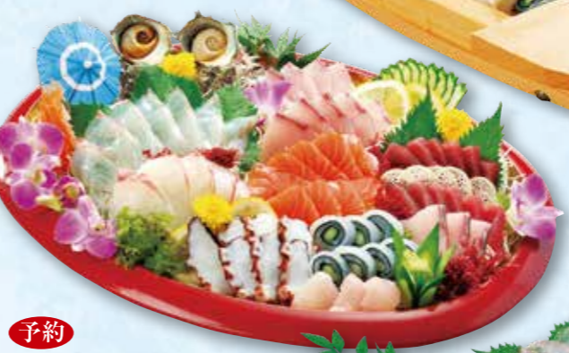
予約 11-7 45cm 刺身〈4人前〉 9,720円