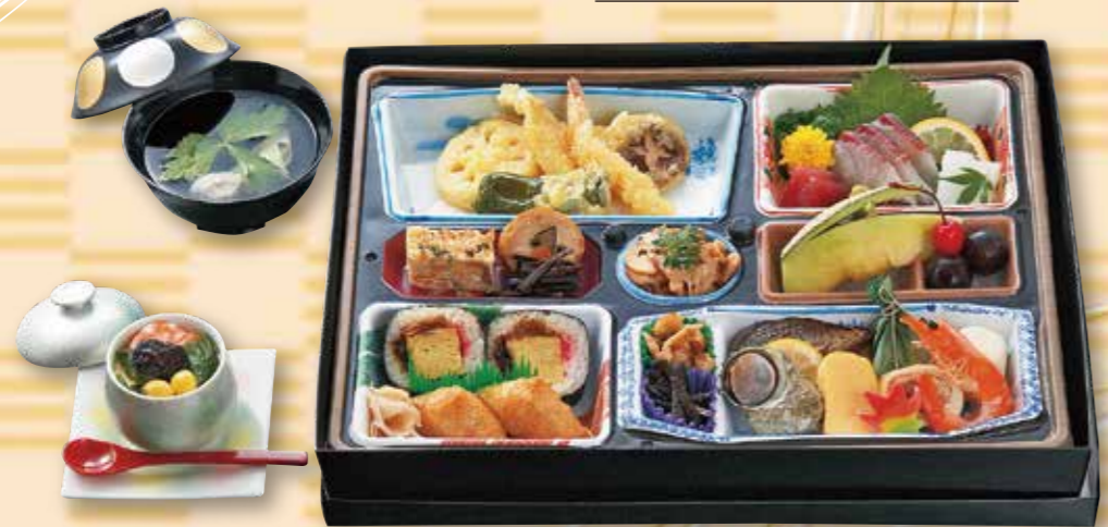
予約 14-2 松華堂B 7,200円