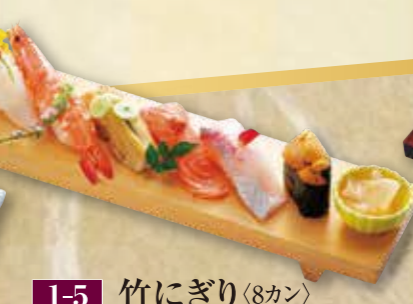
1-5 竹にぎり(8カン) 3,300円