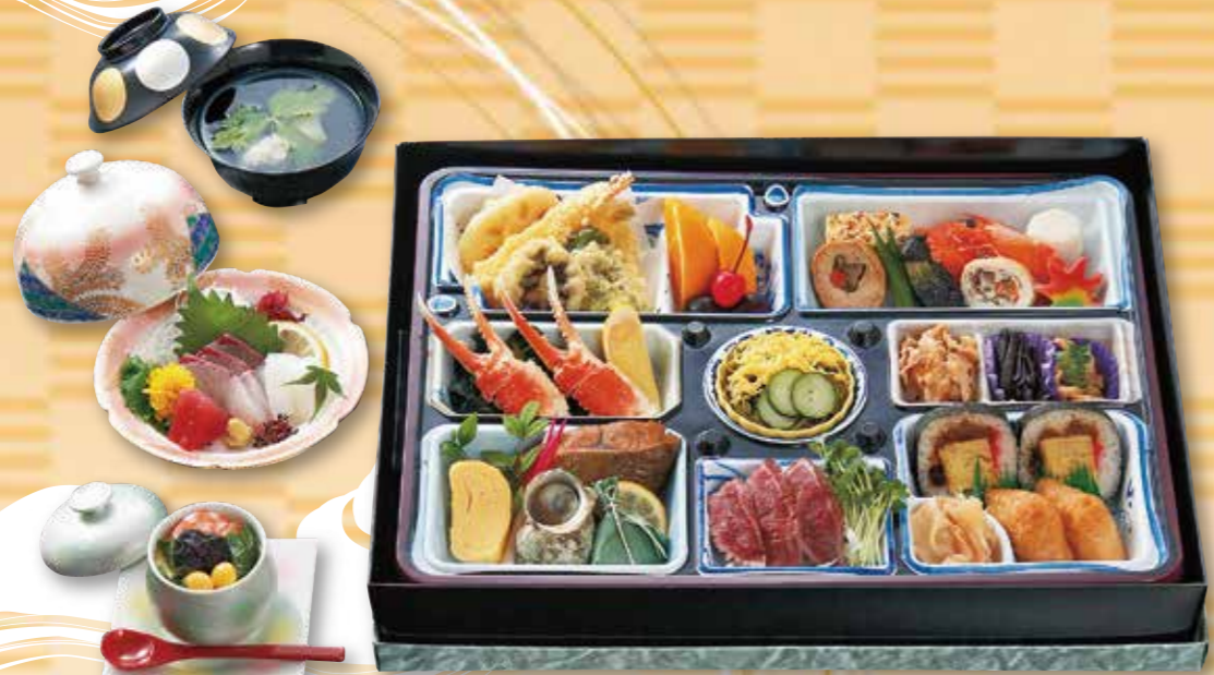
予約 14-1 松華堂A 8,000円