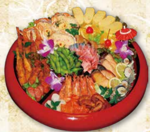
予約 12-3 44cm 〈3~4人前〉 9,720円