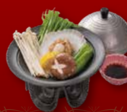
陶板焼 760円 蒸し物 800円