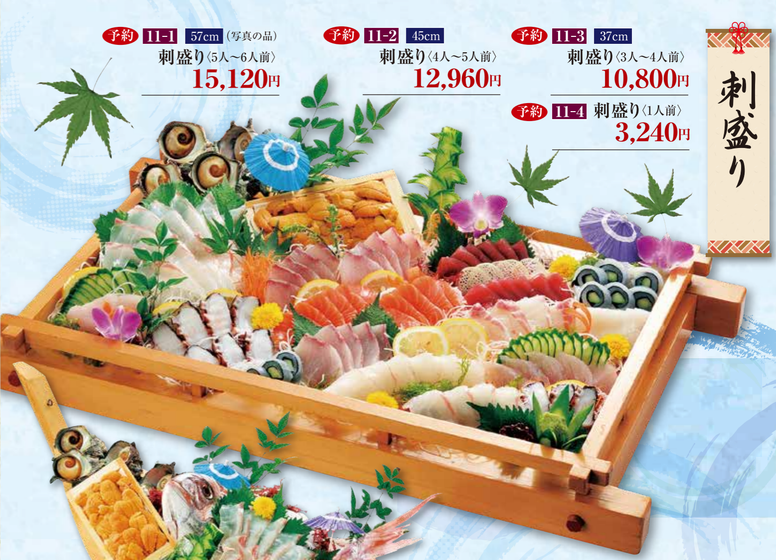
予約 11-1 57cm (写真の品) 刺盛り〈5人~6人前〉 15,120円