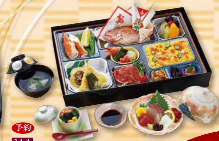
予約 14-4 祝松華堂 8,000円