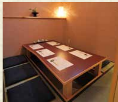
大切な方のご接待に お使い頂ける完全個室も ご用意しております。