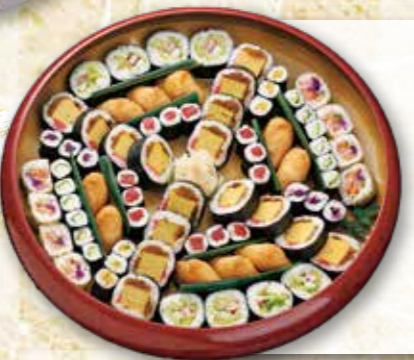
予約 12-5 50cm 〈5~6人前〉 5,400円 予約 12-6 42cm 〈4~5人前〉 4,320円 予約 12-7 42cm 〈3~4人前〉 3,240円