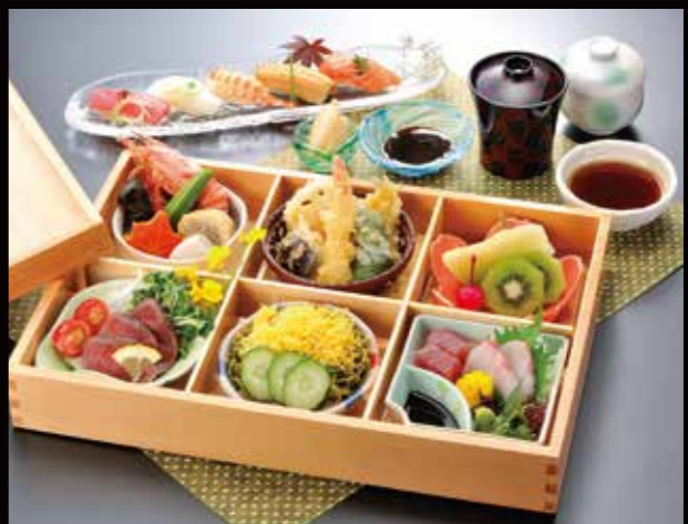
予約 13-6 松華堂 6,000円