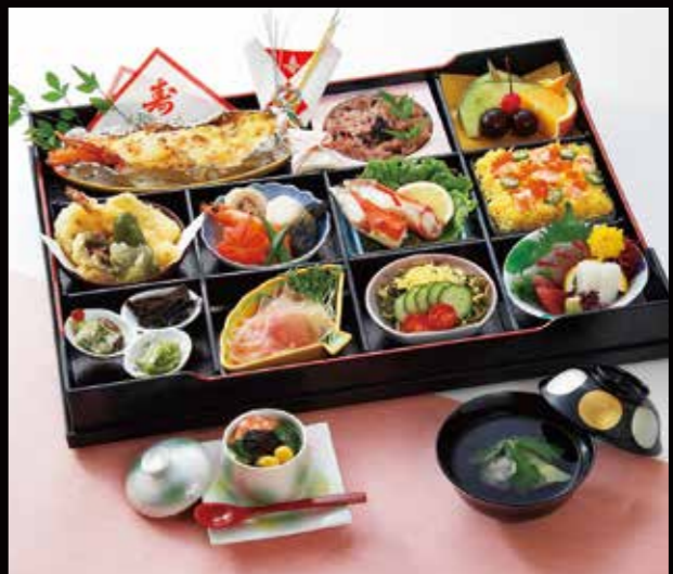
予約 13-1 祝松華堂 9,000円