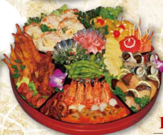
予約 12-2 47cm 〈4~5人前〉 11,080円