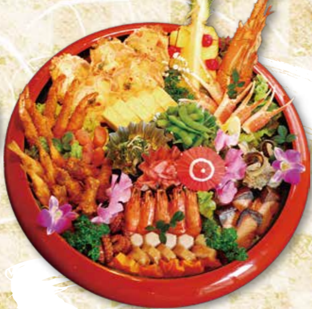
予約 12-1 51cm 〈5~6人前〉 14,040円