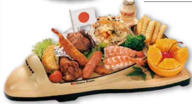
12-33 お子様セット 1,620円