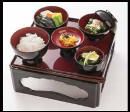
予約 13-2 かげ膳 1,200円