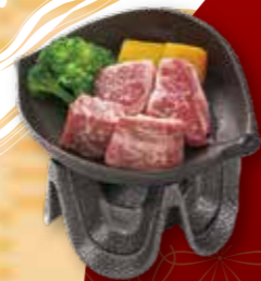
鉄板焼 1,780円 鍋※11月~3月 1,080円