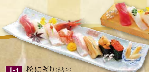
1-4 松にぎり(8カン) 3,900円