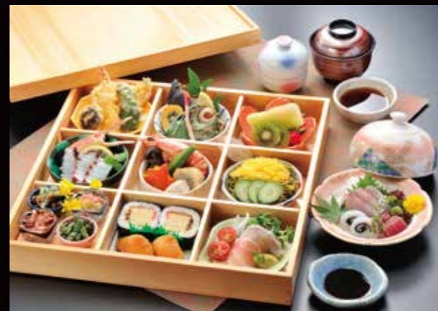
予約 13-3 松華堂 7,500円