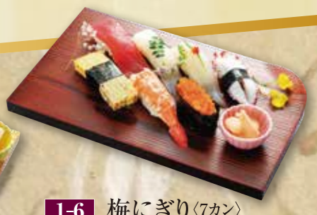
1-6 梅にぎり(7カン) 2,200円