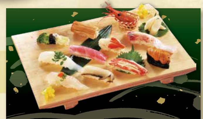
1-3 特上にぎり(10カン) 5,200円