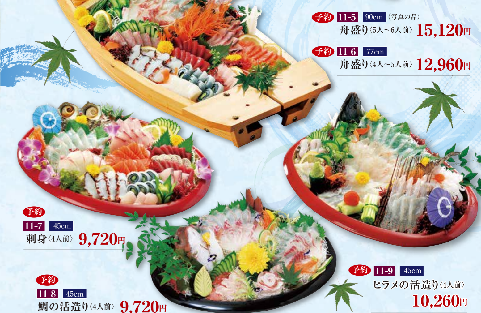
予約 11-5 90cm (写真の品) 舟盛り〈5人~6人前〉 15,120円