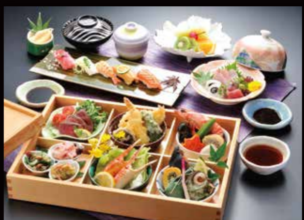
予約 13-4 松華堂 7,000円